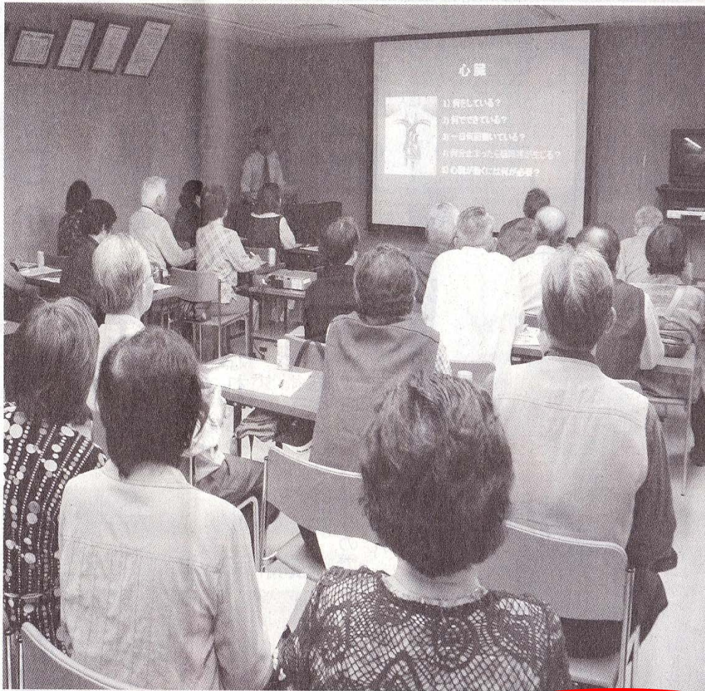
第1回講座「胸が痛くなったら」の様子＝犬山中央病院で